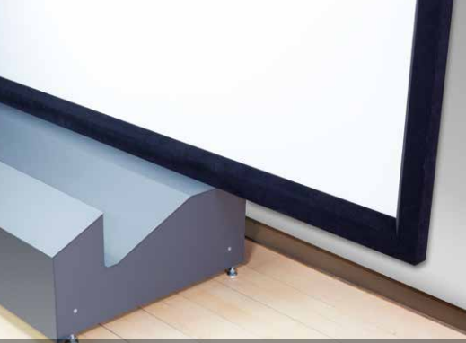
Nur 65 cm Bautiefe