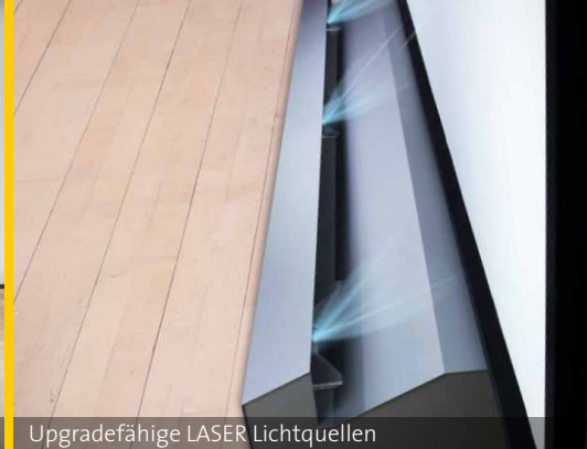
Upgradefähige LASER Lichtquellen