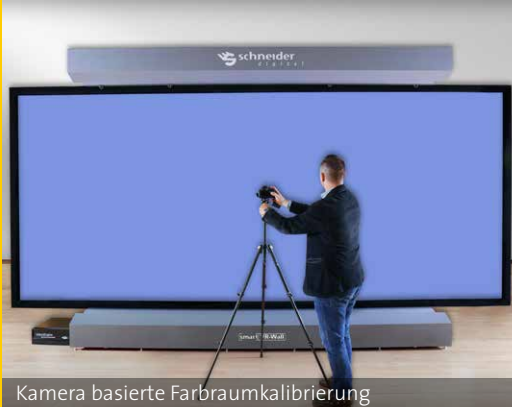
Kamera basierte Farbraumkalibrierung